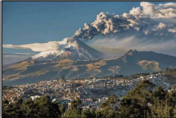
Document 1 : Eruption du volcan Cotopaxi vue depuis la ville de Latacunga.

En Equateur (Amérique du Sud), dans la région de Latacunga, le volcan explosif Cotopaxi est entré en éruption le 18 août 2015 après 138 ans de «sommeil».